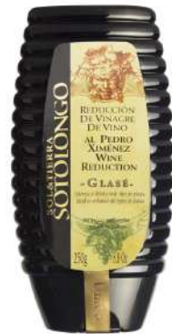
Reducción de vinagre balsámico al PX 250gr