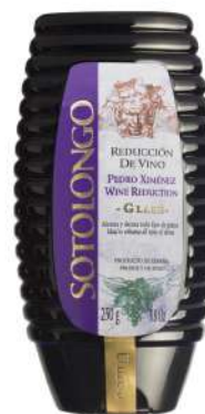
Reducción de vino Pedro Ximénez 250gr