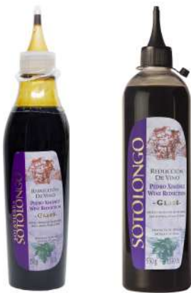
Reducción de vino Pedro Ximénez 250ml 400gr